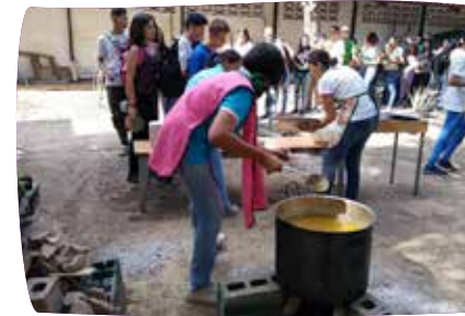
Mangels Gas wird das Mittagessen für die Schülerinnen und Schüler im Innenhof der Schule auf Holz gekocht. Für viele ist es die einzige Mahlzeit am Tag.

Um die Versorgungslage armer Familien im krisengeschüttelten Venezuela zu verbessern, haben Ordensfrauen in Barquisimeto das Projekt „Hoffnung säen“ ins Leben gerufen. Die Ordensfrauen bringen den Jugendlichen bei, Gemüse und Obst selbst anzubauen. Dafür haben sie einen eigenen Schulgarten angelegt und eine Zisterne gebaut. Adveniat hat das Projekt mit 4.000 Euro unterstützt – dank Ihrer Hilfe!