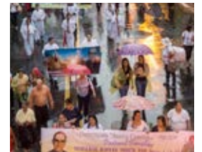
Rückseite: Am Vorabend der Seligsprechung, 2015