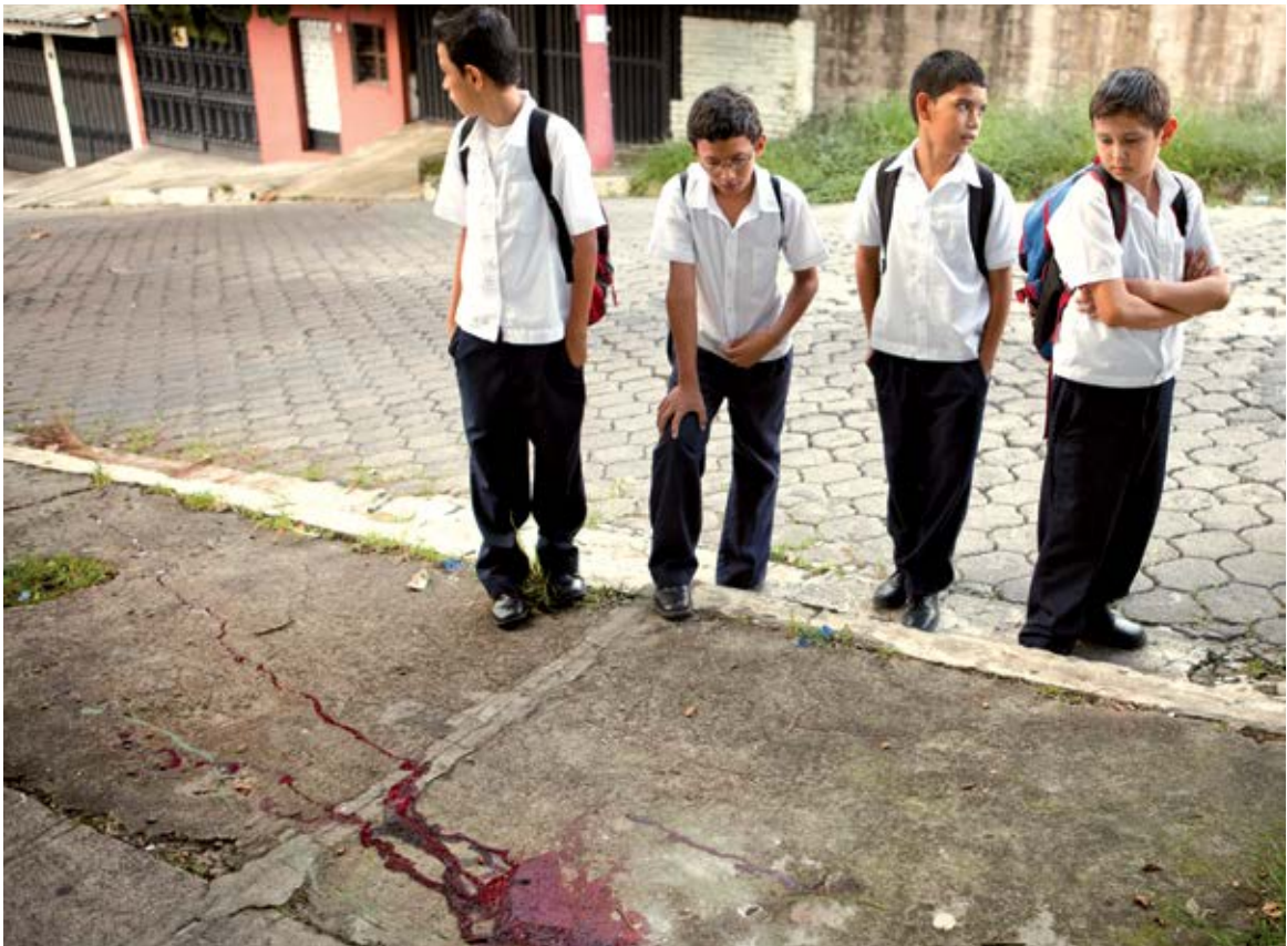
Alltag in San Salvador: An dieser Stelle wurde ein Schüler aus dem Stadtteil Soyapango erschossen.

Ich nenne diesen jungen Mann Óscar. Er kommt aus einem der Armenviertel, in denen es unendlich viele pandilleros (Bandenmitglieder) gibt: alte und neue pandilleros, ebenso Familien von pandilleros und Kinder, die Banden angehören. Bandenmitglieder über Bandenmitglieder, die das Gesicht der Armut tragen.